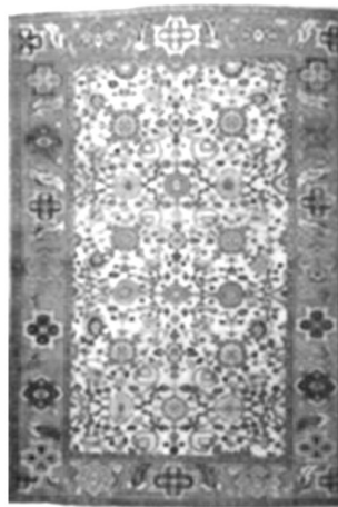
شکل ۴. قالیچه تولید شرکت زیگر، محال [۸]