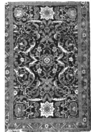
شکل ۳. قالیچه مشک‌آباد [۸]