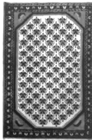
شکل ۲. قالیچه ارمنی باف [۸]

مواد رنگزای خامه فرش دستباف در استان مرکزی پوست گردو، برگ مو، روناس، پوست انار و نیل است. اسپرک، جفت، دانه و رزک و میوه سبز انگور در محلات به مقدار کمتر استفاده می‌شدند. تهیه روناس از یزد، پوست انار جنگلی از چهارمحال بختیاری و خرم‌آباد و اسپرک از مشهد بود. برگ مو در مرزگران خشک شده و در رنگرزی خامه